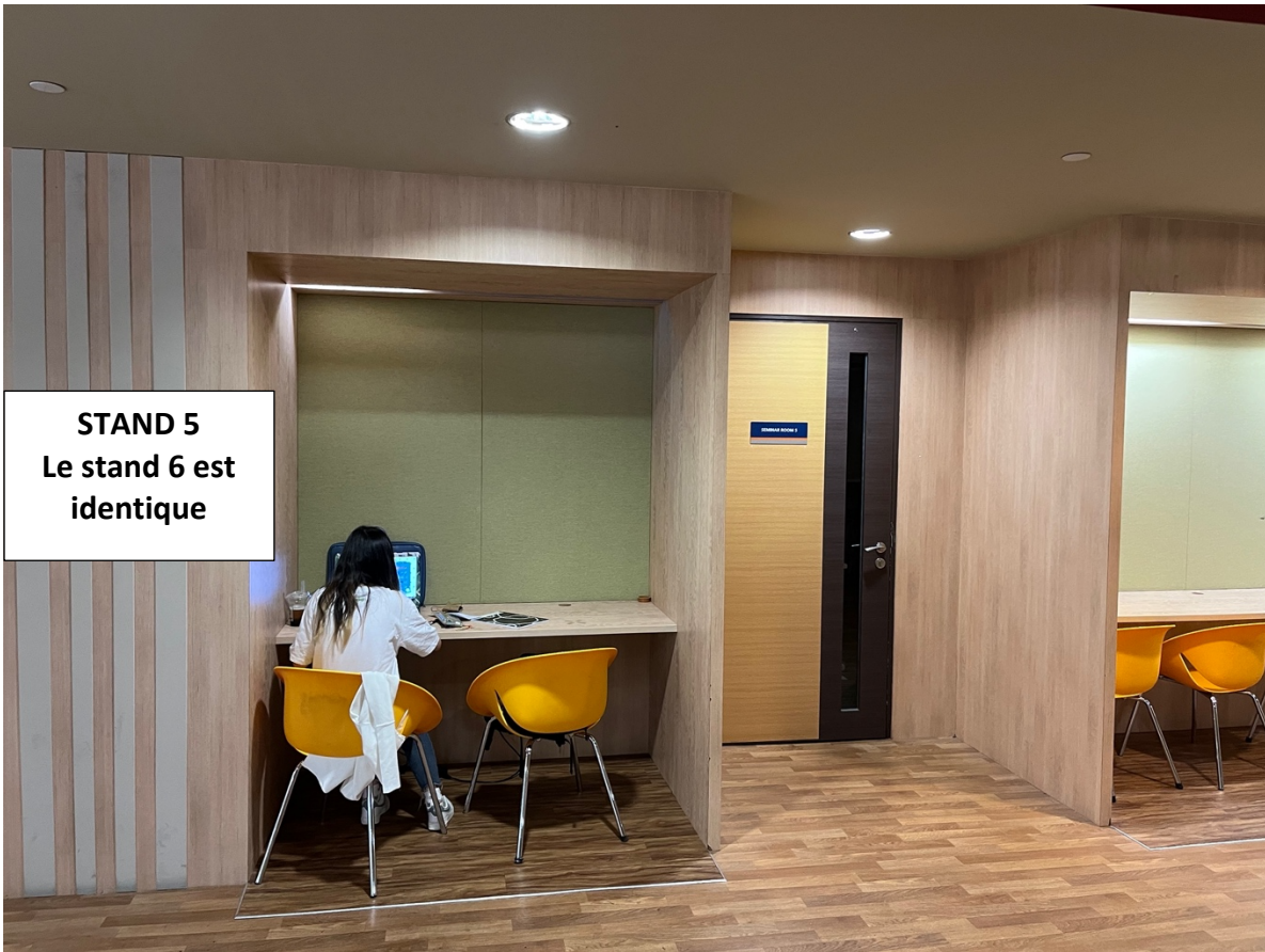
STAND 5 Le stand 6 est identique