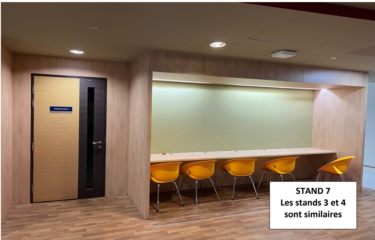
STAND 7 Les stands 3 et 4 sont similaires